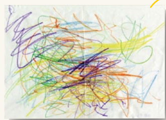
生まれて初めて描いた絵を使用して

ステンレス W150×H150×t3(mm) 約0.5kg 書体：オブチマ 文字&絵：UVダイレクトプリント