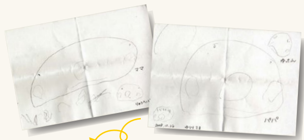
幼い頃にしか描けない表現で描かれたご家族のお顔