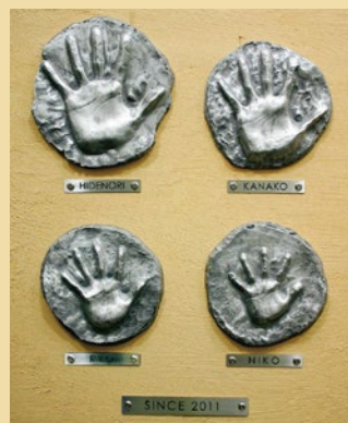
※壁面取付イメージはアル・テBセット

① 同梱のねんどは6ヶ月以内に使用してください。石こうでとった型は弊社に1年以内に郵送してください。