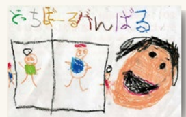
ご兄妹でそれぞれ描いた絵を組み合わせてひとつのプレートに